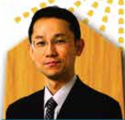
井上 慶太 九段