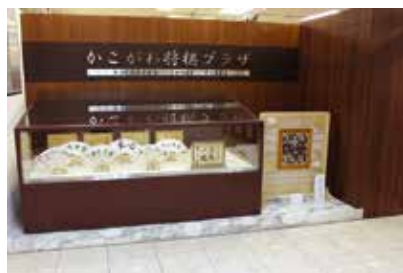
▲入口展示コーナー 時期に合わせてさまざまな将棋に関するものを展示しています。

かこがわ将棋プラザはJR加古川駅からすぐ近くにあり、加古川市ゆかりのプロ棋士の直筆扇子などの展示や、将棋教室を開催しています。お気軽にお立ち寄りください。