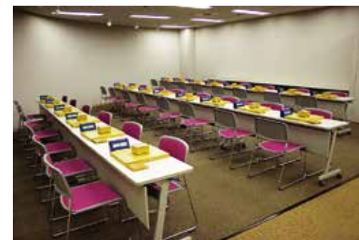
▲教室スペース 初心者から上級者までを対象として、プロ棋士が将棋の教室を開催します。 教室の内容は別途お問い合わせください。